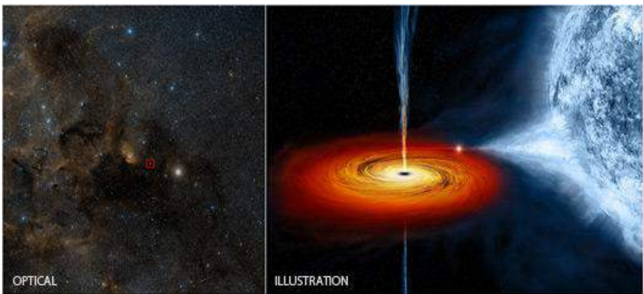
Fig. 1: La fuente de rayos X más brillante del cielo, Cygnus X-1. Izquierda, imagen óptica de su localización, tomada por el Deep Sky Survey. Derecha, ilustración artística del sistema de Cygnus X-1, mostrando el agujero negro, el disco de acreción a su alrededor (en amarillo/rojo) y la estrella azul compañera que provee el material acretado. Se observa la eyección de materia en forma de jets desde la región central del disco de acreción. Imágenes tomadas de la página del observatorio Chandra 3 ; créditos: Imagen óptica: DSS; Ilustración: NASA/CXC/M.Weiss.

Por lo antedicho, cuando en la década de 1960 se detectó la primera fuente celeste emisora de rayos X (Cygnus X-1; Fig. 1), que pudo identificarse ópticamente con una estrella compañera masiva orbitando alrededor de un objeto invisible unas quince veces más masivo que el Sol, ésta se consideró como una fuerte evidencia a favor de la existencia de un sistema binario con un agujero negro. Hoy en día se conocen muchos de estos sistemas, llamados binarias de rayos X (Fig. 2), y en una veintena de casos se ha logrado determinar que las masas de los objetos compactos son consistentes con las de los agujeros negros de masa estelar.