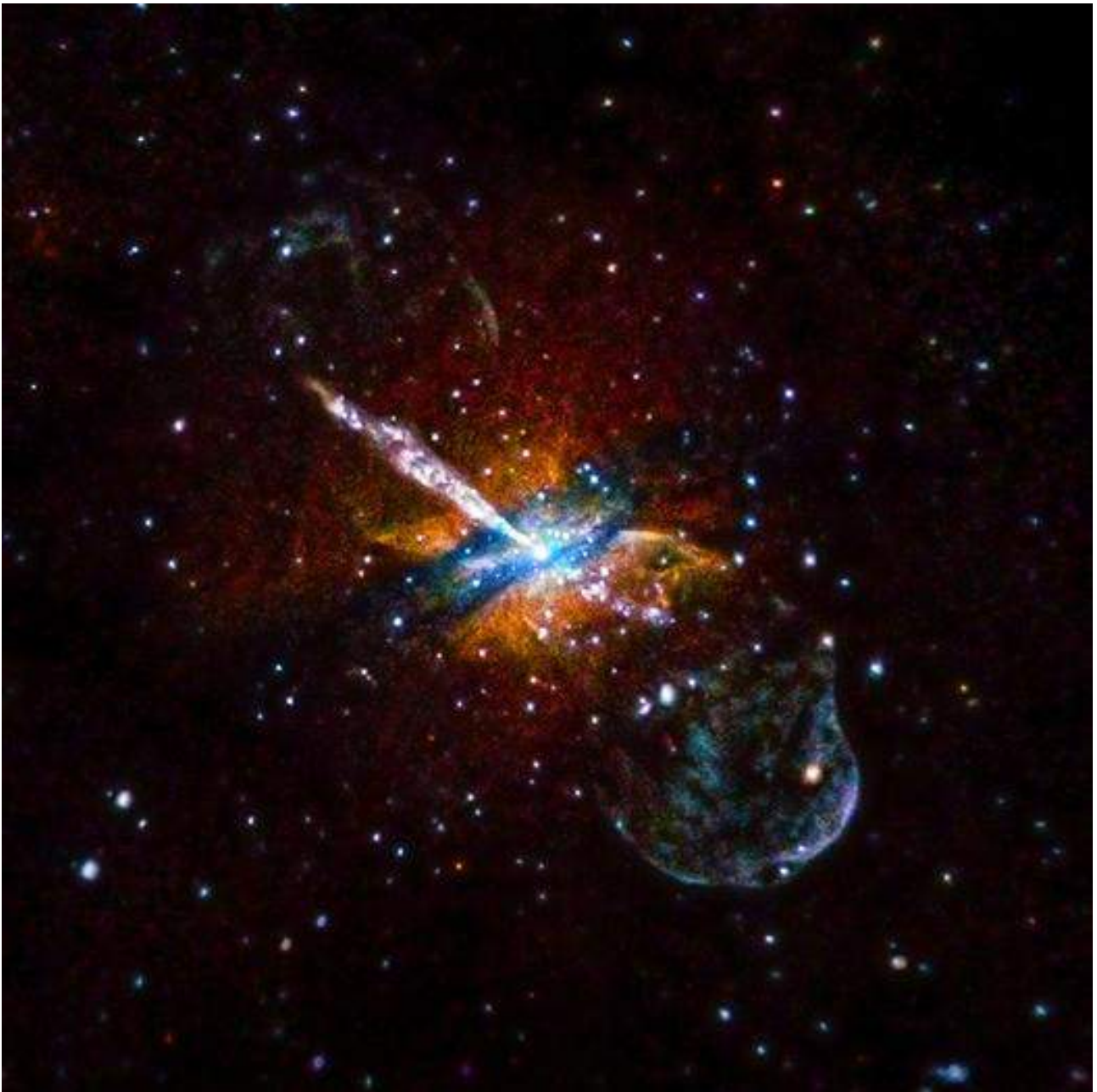
Fig. 3: Uno de los núcleos galácticos activos más cercanos, ubicado en la galaxia Centaurus A, visto en rayos X por el observatorio Chandra de la NASA. Se observa claramente la emisión del núcleo en el centro de la galaxia, y el potente jet (visible desde el centro de la galaxia en dirección al ángulo superior izquierdo de la imagen) que se desarrolla a lo largo de una distancia comparable al tamaño de la galaxia misma.

Los núcleos galácticos activos pueden detectarse gracias a la acreción de materia sobre los agujeros negros supermasivos. Sin embargo, es posible que no haya en la galaxia suficiente material disponible para acretar, o que la tasa a la cual éste se acreta sea relativamente baja, en cuyo caso la fenomenología descrita no se observaría. Tal es el caso del agujero negro central de la Vía Láctea, nuestra galaxia, que se ha detectado recientemente basándose en la influencia gravitatoria que ejerce sobre las estrellas cercanas al mismo. Las órbitas de estas estrellas permiten estimar su masa en aproximadamente 4.000.000 M_{\odot} . Si bien existe una radiofuente (Sagittarius A* ; Fig. 4) coincidente con la posición del agujero negro central, cuya emisión podría deberse al proceso de