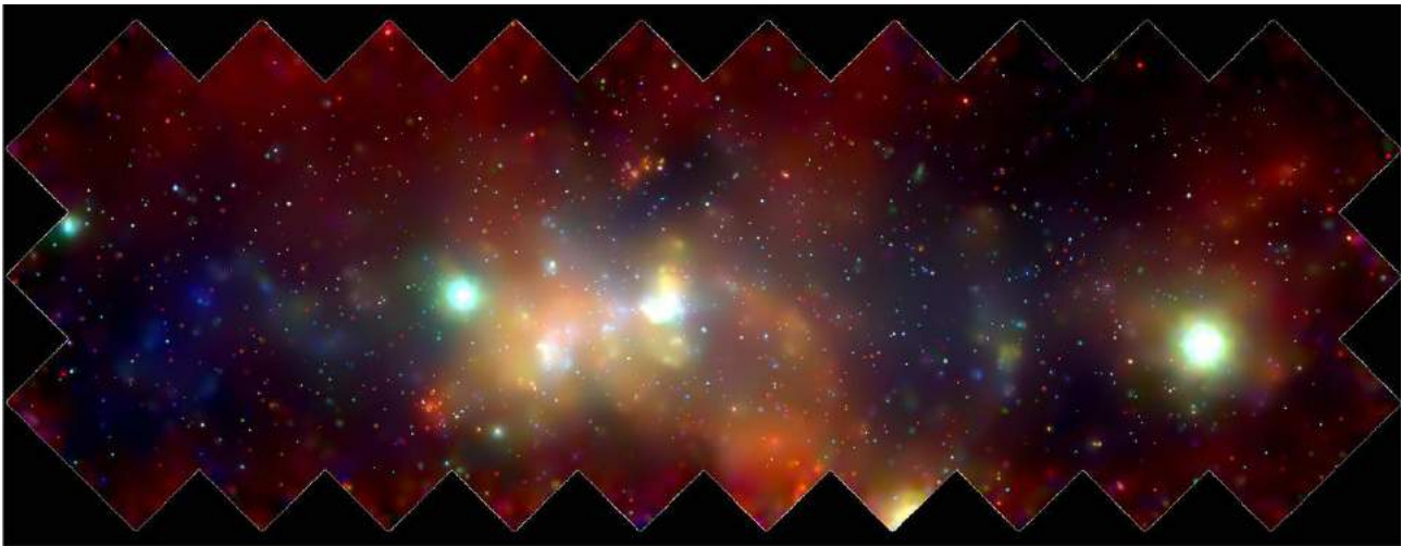
Fig. 2: La región del centro Galáctico vista en rayos X por el observatorio Chandra de la NASA. Los numerosos puntos brillantes que se observan sobre el fondo difuso son en su mayoría binarias de rayos X que contienen objetos compactos acretantes, muchos de ellos agujeros negros.

En los sistemas binarios con objetos compactos, la acreción se produce a través de un disco formado por la materia que cae (Fig. 1). La rotación diferencial de este disco, junto con el campo magnético del material acretado hacen que parte de este último sea eyectado del sistema antes de caer al agujero negro. Este material es acelerado a velocidades cercanas a la de la luz, formando un par de chorros de materia (llamados jets ) que parten de la región central del sistema y se extienden hasta distancias considerables de la fuente. Los electrones presentes en los jets emiten radiación de sincrotrón, mayormente en la región de radio, infrarroja y visible del espectro electromagnético. Muchas de las binarias de rayos X detectadas presentan emisión de este tipo, que indica la presencia de jets. Estos sistemas son llamados microcuásares ; para una descripción de su fenomenología, recomendamos leer el artículo de Vila 4 en el Boletín Radio@stronómico número 30.