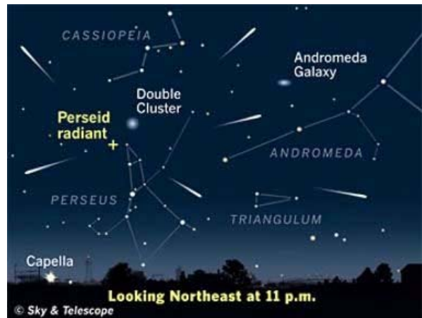
Martes, 12: Lluvia de meteoros de las Perseidas.