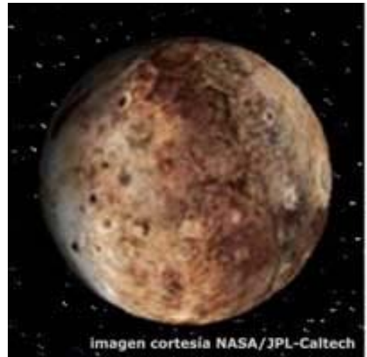
24 agosto 2006: Plutón es reclasificado como Planeta Enano por la Unión Astronómica Internacional.