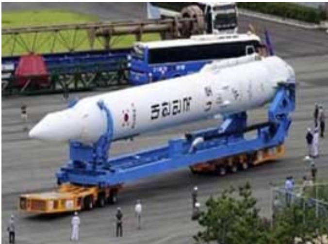
25 agosto 2009: Corea del Sur lanza su primer satélite artificial.