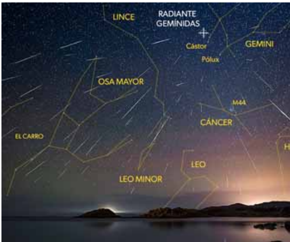
Miércoles 14. Gemínidas: La Tierra atraviesa la corriente de residuos del cometa 3200 Phaethon, que es la fuente de meteoros de la lluvia anual de las Gemínidas.

Continúa la conjunción de la Luna y Júpiter en los últimos días del mes y del año. Este mes de diciembre conmemoramos los 20 años de la muerte de Carl Sagan, el astrofísico y divulgador estadounidense que sacó la astronomía de las aulas universitarias y los centros de investigación y la colocó en los televisores de millones de hogares, con una forma muy novedosa de comunicar la ciencia. En diciembre de 1903 tuvo lugar el primer vuelo a motor de la historia.