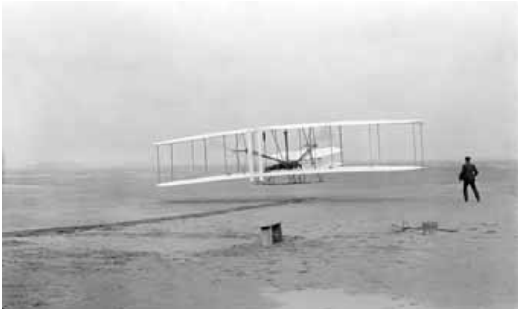
1903. Primer vuelo en avión. Fotografía original del primer vuelo con motor de la historia. A los mandos Orville Wright; a la derecha, su hermano Wilbur. diciembre de 1903.