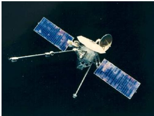
El día 29 de marzo de 1974 la nave Mariner 10 comenzó a enviarnos imágenes cercanas del planeta Mercurio.