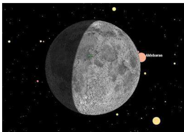
El día 21 podrá observarse desde Europa la ocultación de la estrella Aldebarán por la Luna.