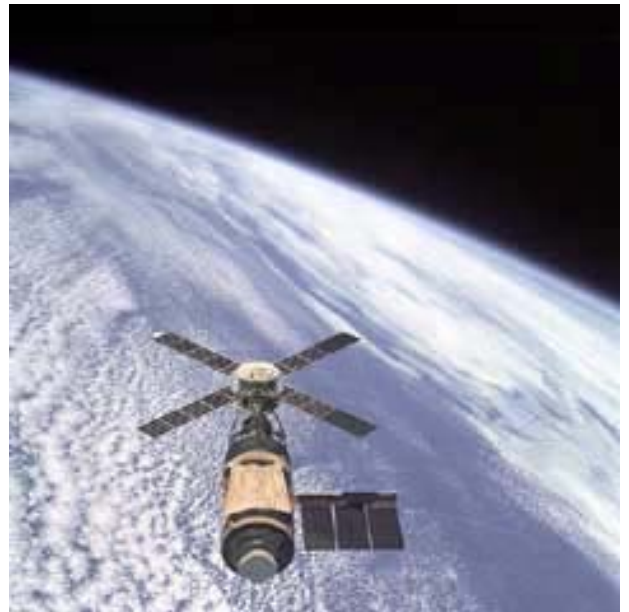
En 1973 se lanza la estación espacial Skylab.