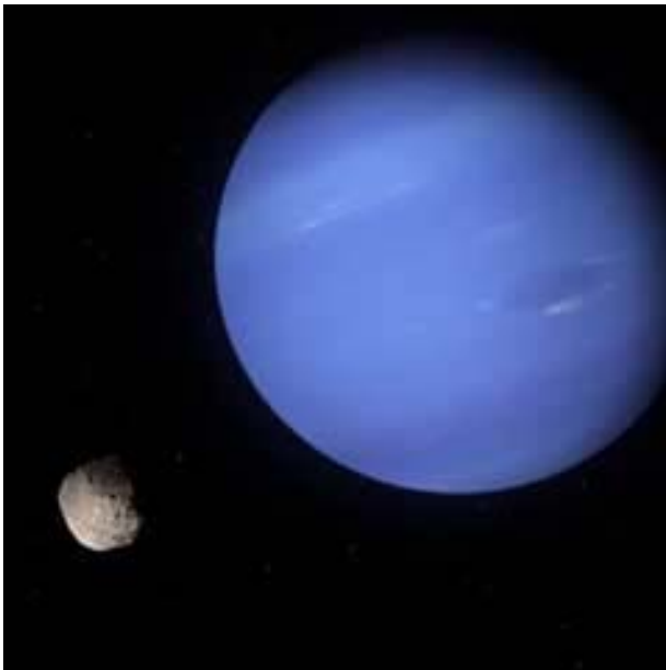
En 1949 Gerard Kuiper descubre a Nereida, una de las lunas de Neptuno.